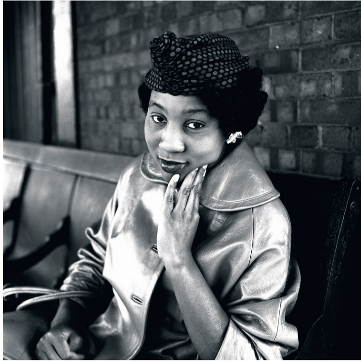
■ Zonder titel, 1957.