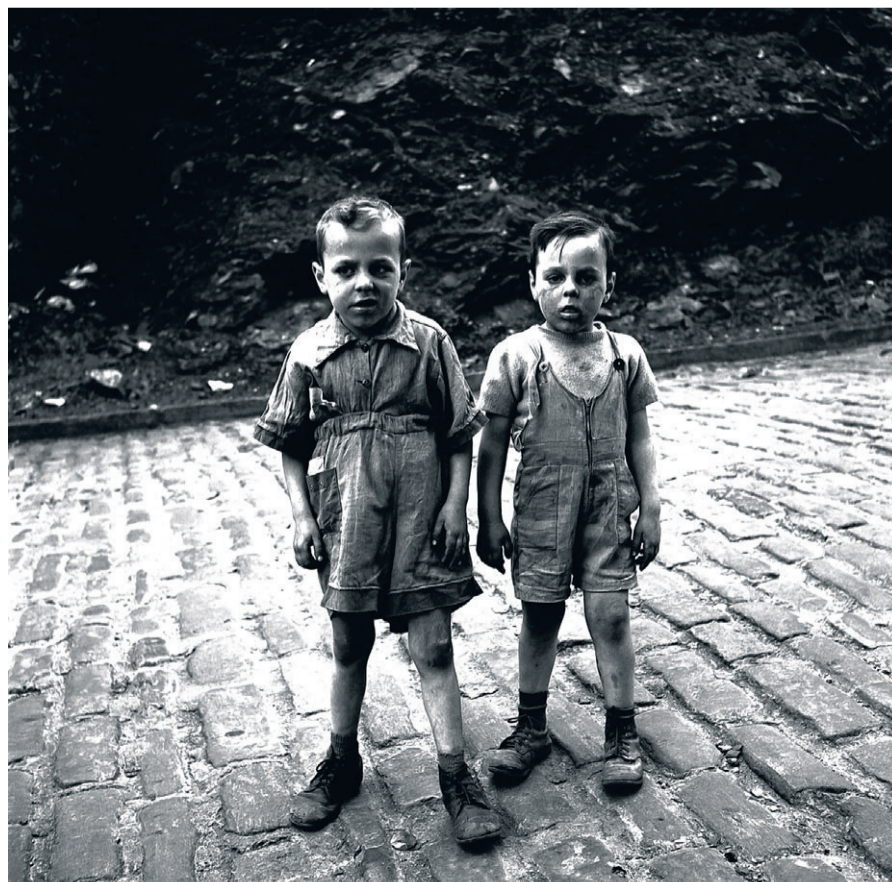
■ Zonder titel, ongedateerd, Vancouver, Canada.