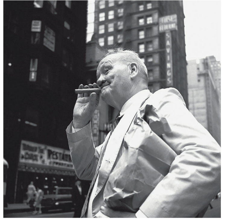
■ Zonder titel, ongedateerd, Chicago.