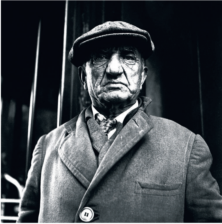
■ Zonder titel, 1956, New York.