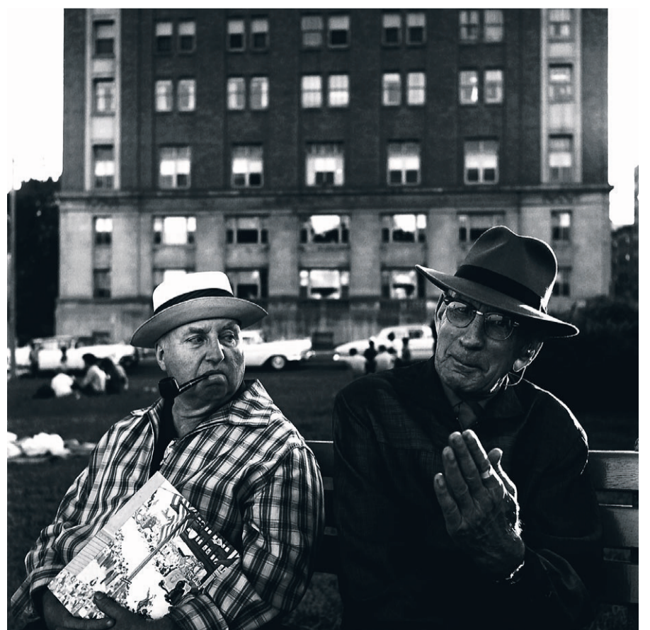
■ Zonder titel, ongedateerd.