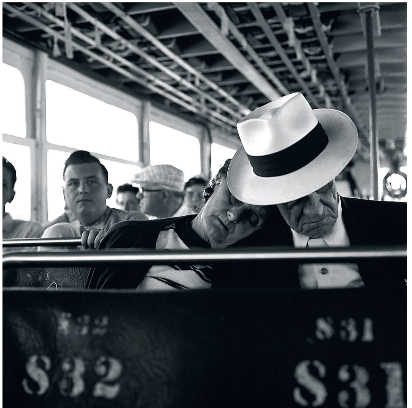
■ Zonder titel, april 1960, Florida.

Vivian Maier: Twinkle, twinkle little star , in Galerie Hilaneh von Kories, Hamburg, tot 28 april, www.galeriehilanehvonkories.de Finding Vivian Maier, Chicago Street Photographer , in Chicago Cultural Center, tot 3 april, www.chicagoculturalcenter.org