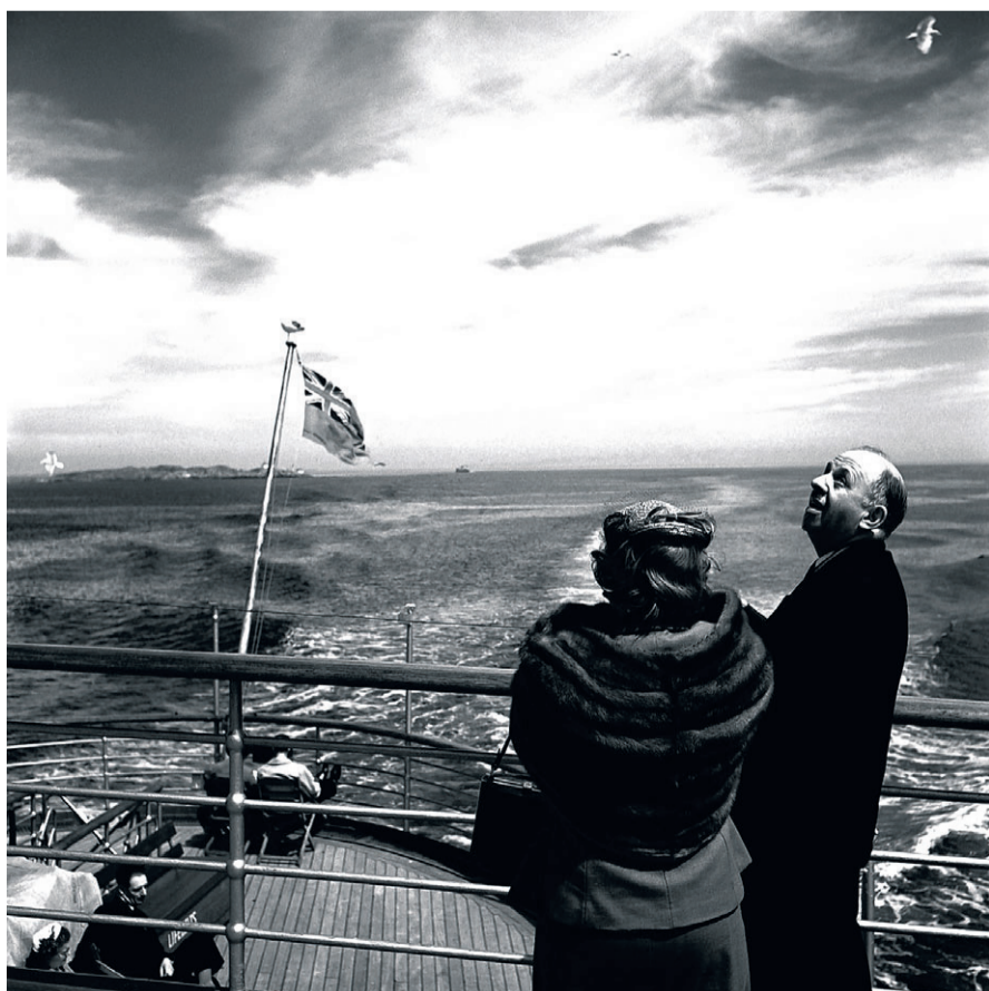
■ Zonder titel, ongedateerd.

Vivian Maier, nanny in Chicago, was een chroniqueur van het alledaagse. Maar niemand kreeg haar foto's ooit te zien